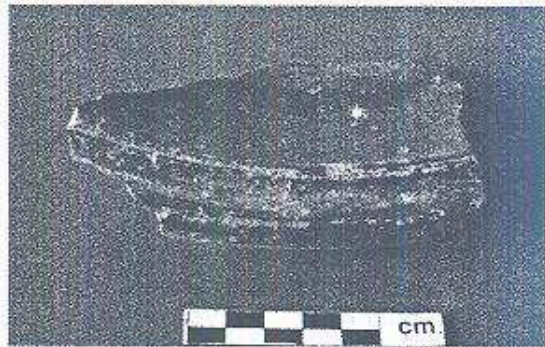
Ejemplar del Tipo Cerámico Sierra Rojo