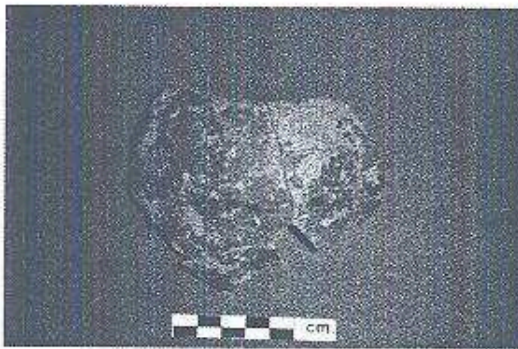
Ejemplar del Tipo Cerámico Leona Rojo Sobre Naranja